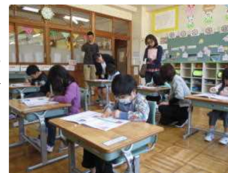
1年生 国語「うたにあわせてあいえぬ」